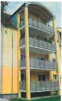
Umbau ehemalige Kaserne