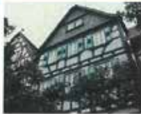
Denkmalpflege am Dalberg